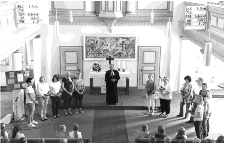
Dank an die Hoyamütter und einen –vater beim Abschlussgottesdienst in Rethem