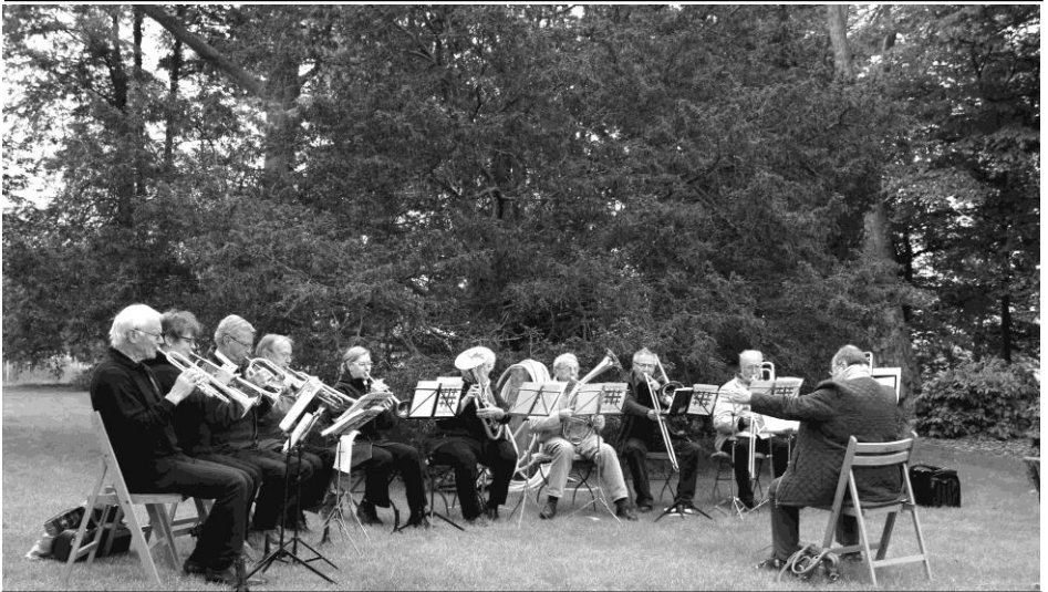
Posaunenchor beim Himmelfahrtsgottesdienst auf dem Hof Thimm in Kirchwahlingen