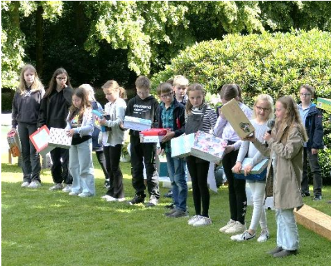
Hoya-Abschluss / Ausflug Frauenhilfe